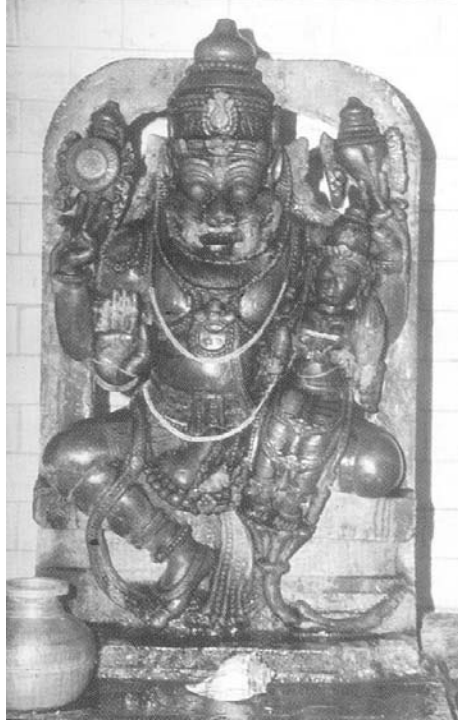
ಶ್ರೀಮಠದ ಪೂಜಾದೈವತ ಶ್ರೀ ನರಸಿಂಹ