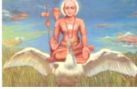
ರಾ ಗ - ಭೈ ರ ವಿ : ತಾ ಳ - ಅ ಟ ತಾ ಳ